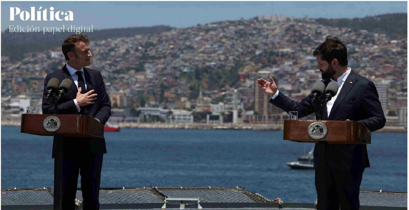
► Los presidentes de Francia, Emmanuel Macron, y de Chile, Gabriel Boric, en un acto en Valparaíso.