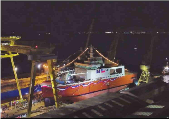
EL ROMPEHILOS VIEL, PLENAMENTE DOTADO DE AVANZADOS SISTEMAS DE INVESTIGACIÓN CIENTÍFICA, ES EL MAYOR BUQUE CONSTRUIDO EN CHILE.

"Al respecto, no obstante que el Secretario General de Naciones Unidas fue, por Nota, informado que Argentina rechaza la proyección geológica y geo-legal de nuestra plataforma magallánico-antártica (al oriente de la longitud 74°Oeste), para nosotros lo concreto es que, conforme con el Derecho Internacional, la mencionada región chilena se