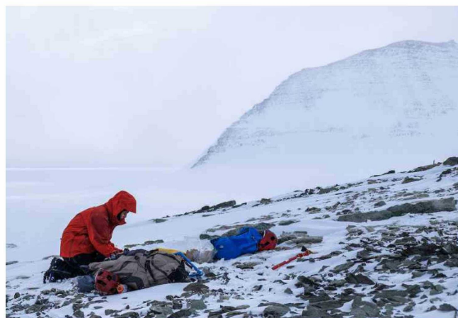
LA CIENCIA ANTÁRTICA ES FUNDAMENTAL, PERO GUZMAN CREE QUE EL INTERÉS CIENTÍFICO DE CHILE DEBE CENTRARSE EN DEFENDER NUESTRA SOBERANÍA.

A su juicio, ante este escenario "Chile debe prepararse para cualquier eventualidad. No hacerlo no solo no resol-