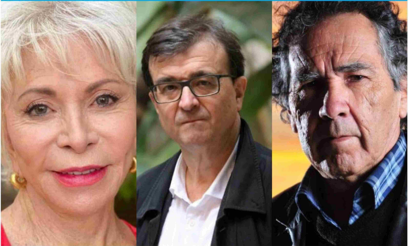
► Los autores nacionales Isabel Allende (izquierda) y Hernán Rivera Letelier (derecha) junto al escritor español Javier Cercas (centro).