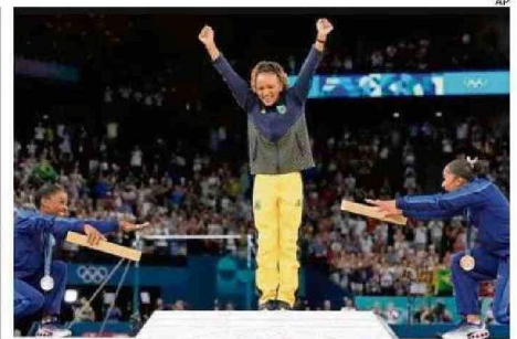
LAS ESTADOUNIDENSES RECONOCIERON HUMILDEMENTE A LA CAMPEONA.