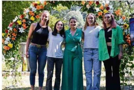
JÓVENES DEPORTISTAS POSTULAN EN CATEGORÍA DE VALDIVIA DESTACA.

En ese contexto, es que mencionó algunos elementos