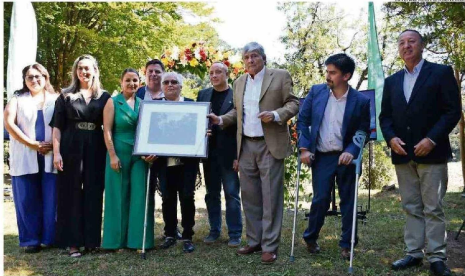
AYER FUERON ENTREGADOS RECONOCIMIENTOS A DISTINTAS PERSONAS QUE HAN APORTADO A LA COMUNIDAD.

Más adelante, la alcaldesa sostuvo que Valdivia no está ajena a la ocurrencia de emergencias e incendios, los que han afectado a vecinos y, en ese contexto, destacó que la comuna fue una de las primeras del país en contar con una dirección municipal de gestión de riesgos y de desastres, "con nuestros planes de emergencia aprobados y vigentes, con convenios de colaboración permanente con Bomberos para capacitar en prevención y actuar rápidos