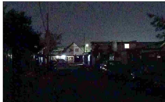
El pasaje Eucaliptus luce completamente a oscuras por las luminarias apagadas por más de dos meses y nadie hace nada.

« Hola muy buenas noches, disculpe por molestarle, pero le escribo nuevamen-