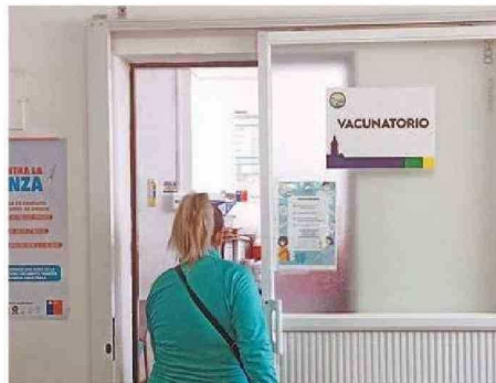
MANTENER CALENDARIO DE VACUNACIÓN PARA COVID ES CLAVE.

En tanto, desde la Seremi de Salud de la Región de