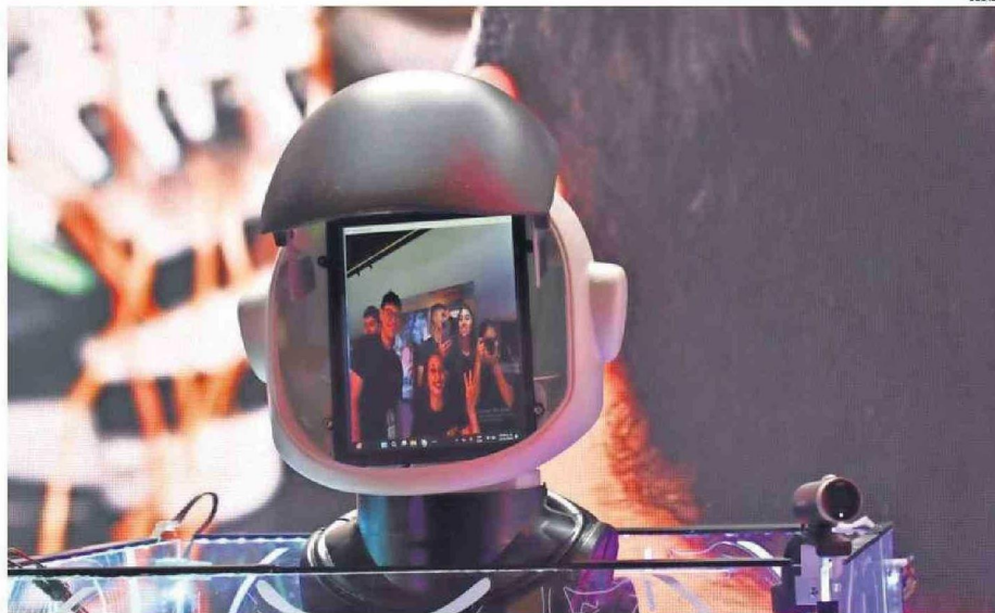
LA CABEZA DE STELARBOT YA ESTÁ LISTA Y SE EXHIBIÓ EN CONGRESO FUTURO 2025. EN EL CASCO SE VERÁ EL ROSTRO DEL USUARIO.