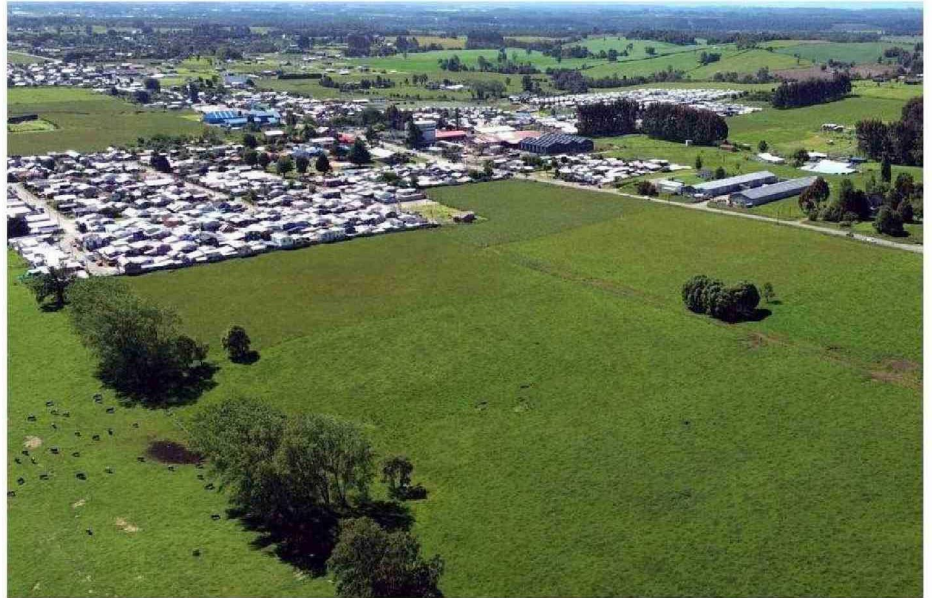
EN UN TERRENO DE NUEVA BRAUNAU, CEDIDO POR EL SERVIU AL MUNICIPIO DE PUERTO VARAS, SE CONSTRUIRÁN VIVIENDAS SOCIALES.