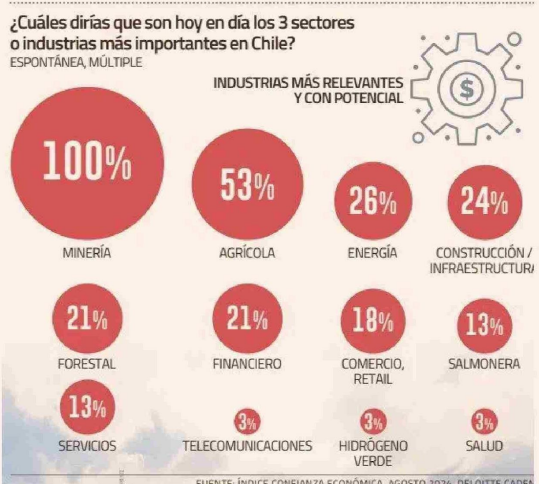
FUENTE: ÍNDICE CONFIANZA ECONÓMICA, AGOSTO 2024, DELOITTE CADEM