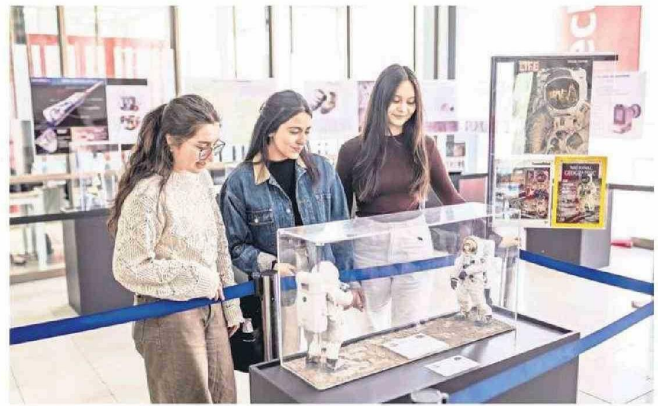
Chile cuenta con condiciones excepcionales para la astronomía y UNAB potenciará esto con su Licenciatura en Astronomía en Concepción.

Por ejemplo, el concepto "Mine to Mill", incluido en el currículo, destaca por su enfoque integral en toda la cadena productiva, desde la extracción hasta el procesamiento de minerales. Los estudiantes aprenderán a utilizar simuladores avanza-