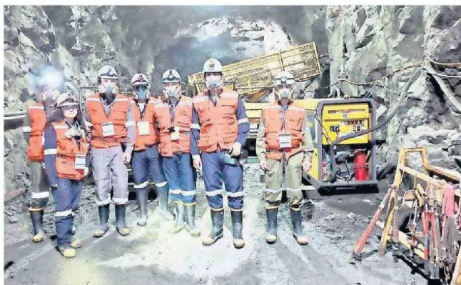
UNAB impartirá desde 2025 la carrera de Ingeniería Civil en Minas en Concepción. La imagen muestra una visita de estudiantes de Ingeniería UNAB a Tierra Amarilla.

Cada programa está diseñado para atender necesidades específicas, desde la digitalización de procesos industriales hasta la investigación científica de vanguardia. "La ampliación de nuestra oferta académica responde a las demandas del mercado laboral, pero también proyecta un futuro de innovación, sostenibilidad y crecimiento para la Región", concluye Chamorro. Las nuevas generaciones tendrán la oportunidad de especializarse en áreas estratégicas, contribuyendo al desarrollo local con un impacto global.