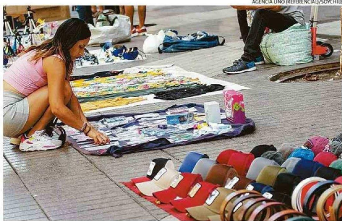
LICITACIÓN FUE ADJUDICADA, POR $53 MILLONES, A LA EMPRESA "CLIODINÁMICA" EN MAYO DEL 2023.

Y la situación sería más grave si se considera que a principios de junio, a soli-