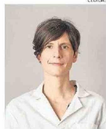
TISCHLER ES BIOTECNÓLOGA.

En esa línea, Tischler comenta que “nos enfocamos en generar un abanico de anticuerpos altamente específicos para el virus Andes, porque sabemos que