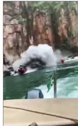
La impresionante secuencia de imágenes muestra cómo el material rocoso cae sobre dos embarcaciones.