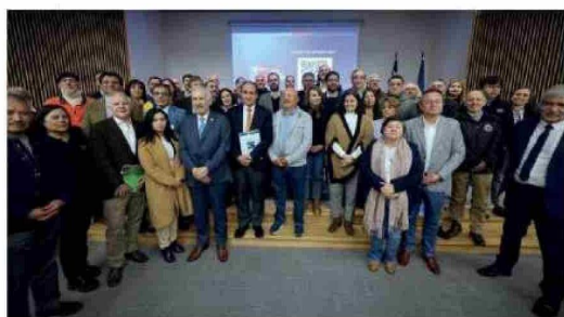
PRESENTACIÓN de las 32 medidas del Plan de Fortalecimiento Industrial del Biobío.

riesgo; reinserción, movilidad laboral y acompañamiento para el resguardo de garantías laborales; acclerar la inversión pública y privada; reactivación y fortalecimiento de la industria en el mediano y largo plazo; y recuperación en el mediano plazo de la producción nacional de acero.