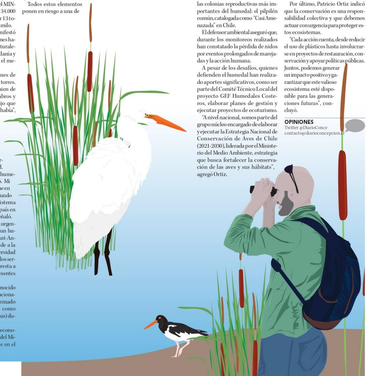
ILUSTRACION: ANDRÉS OREÑA P.

Twitter @DiarioConce contacto@diarioconcepcion.cl