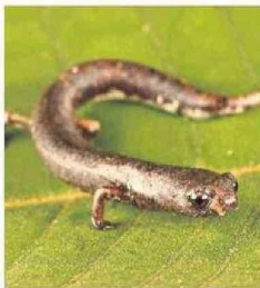
Salamandra ( Bolitoglossa sp.) captada durante la expedición.

Según informó la organización Conservación Internacional