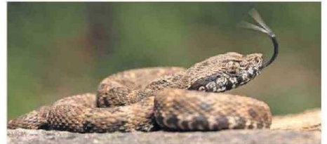
Serpiente ( Bothrops atrox ) fotografiada por la expedición.

Están en curso los descubrimientos de 48 especies de plantas y animales observadas durante la