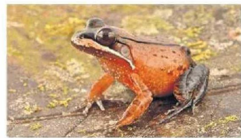
Una rana ( Leptodactylus rhodomystax ) en el bosque peruano.

expedición que también pueden ser nuevas para la ciencia y requieren más investigaciones para su confirmación.