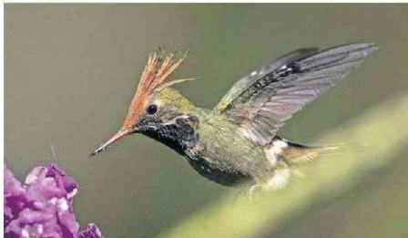
Colibri ( Lophornis delattrei ) captado en la Amazonía peruana.