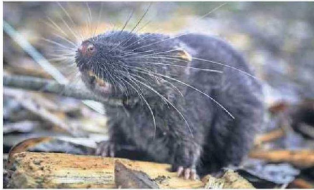
Un ratón anfibio ( Daptomys sp.) es uno de los cuatro mamíferos nuevos descubiertos.