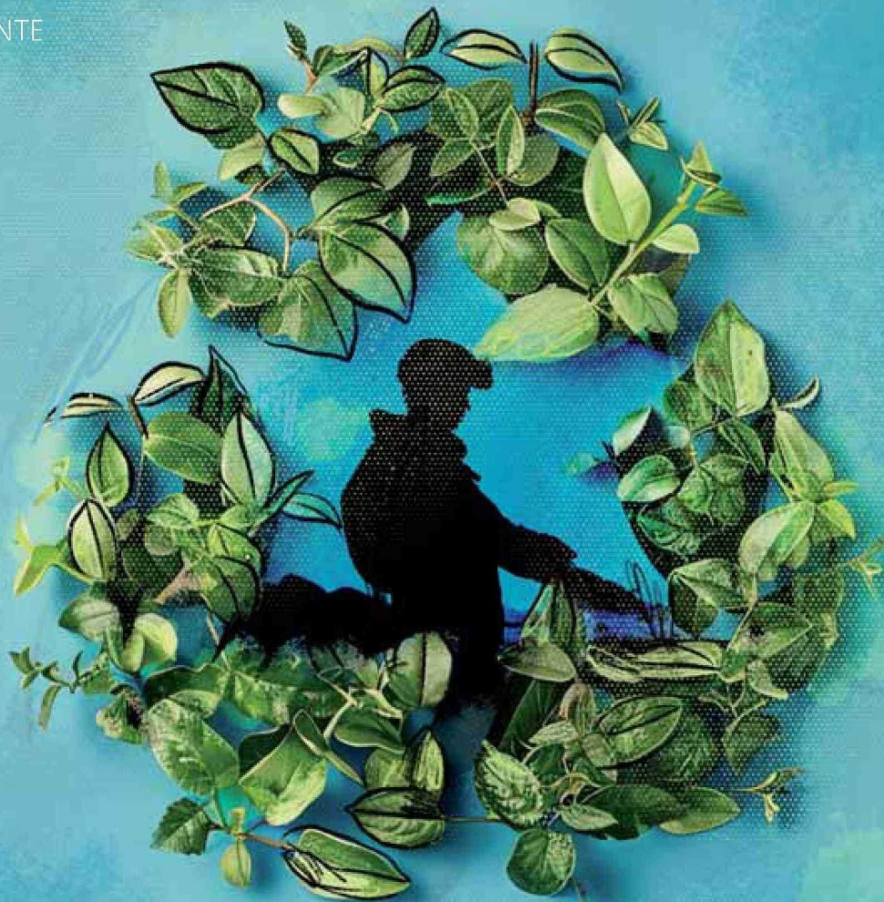
Ilustración: Fabián Ibáñez