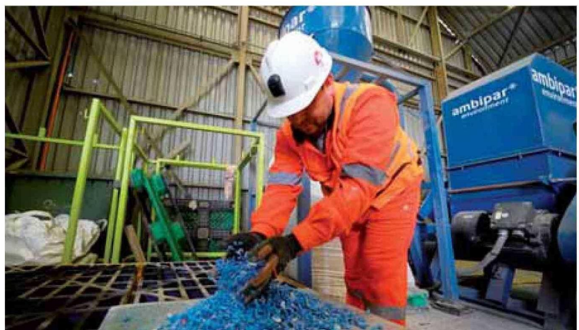
La división El Teniente, de Codelco, ha impulsado el reciclaje de residuos industriales no peligrosos, como la recuperación de chatarra y otras aleaciones metálicas.

La Política Nacional Minera establece como un objetivo central estratégico en materia ambiental impulsar un modelo de economía circular a través de la reutilización de residuos y el uso eficiente de recursos.