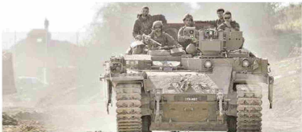
Las tropas abandonan la franja de Gaza hoy, tras acuerdo promocionado por Estados Unidos.

Israel respondió con una ofensiva que ha matado a más de 46.000 palestinos, según funcionarios de salud locales, que no distinguen entre civiles y militantes, pero dicen que las mujeres y