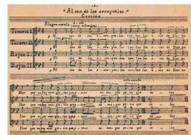
AL SON DE LOS ARROYUELOS, DOMINGO SANTA CRUZ (1941).

que hemos dado está marcado a sangre y fuego por nuestro líder fundador. Nos esforzamos por dar a conocer sus obras, sobre todo en "Pentagrama latinoamericano" por Radio Chilena FM de San Antonio. Nuestra Revista Marsyas volvió a circular porque las publicaciones académicas se distanciaron de lo eminentemente docto. Incorporamos en sus páginas textos inéditos de Santa Cruz, lo que nos llevó a indagar en las citadas instituciones.