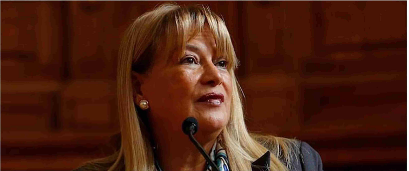
► Hace una semana que se anunció la apertura de un cuaderno de remoción en contra de la ministra Ángela Vivanco.