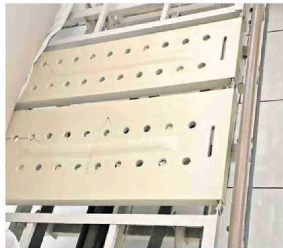
HAY MAL ESTADO EN LAS CAMAS DE PACIENTES.

Entre las problemáticas que acusan es el estado del alcantarillado del área, y a través de una carta señalaron lo siguiente: "Está en condiciones tan precarias que ha llevado al cierre de los baños destinados para usuarios debido a obstrucciones y fugas recurrentes. Esto ha generado un persistente y desagradable olor a desechos en diversas partes del servicio, afectando la calidad del ambiente,