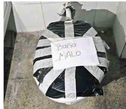
CONDICIONES DEL BAÑO DEL SERVICIO DE UHCIP DEL HOSPITAL.

sostuvieron "diversas instancias de trabajo con el equipo directivo, para abordar lo solicitado por Psiquiatría Infanto Adolescente. Además, junto con el seremi de Salud, y la directora del Servicio de Salud, acudimos a las dependencias de dicha unidad, donde dialogamos con funcionarios, jefaturas y dirigentes".