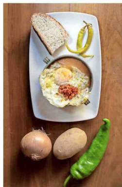
TIMBAL DE PATATA. Chorizo sin piel y puré de papas, con huevo frito encima, en Casa Comidas Irene.

Estas alternativas tienen que encargarse con antelación —online a través de la web de Casa Tila o por teléfono— e incluyen una gran paellera rellena de cremoso arroz de la Albufera de Valencia, cocinado en un caldo de vino de Rioja, además de