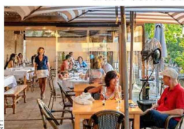
BODEGA PIMIENTO. Casi todo lo que sirven viene de granjas cercanas.

Esta región de España es famosa por algo (sí, vino), pero es hora de darse una vuelta para probar la gastronomía de sitios como estos. POR David Farley.