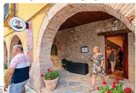
CASA TILA. Este restaurante funciona en una construcción de 1882.

El restaurante, ubicado en un edificio de piedra de finales del siglo XVIII con techos sostenidos por vigas de madera, cuenta con largas mesas y bancos de madera. Casi todo lo comestible proviene de la campiña cercana donde abundan las granjas y los viñedos. El jamón ibérico y el chorizo se curan en casa; las verduras se cultivan en el huerto del restaurante y el cordero procede de una granja local.