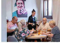
EN CLAVIJO. Casa Tila es un especialista en recetas con arroz.

arroz. Fue un éxito. Tanto es así que cuando los comensales llamaban para hacer reserva, pedían específicamente ese plato de arroz.