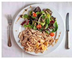
LA CUEVA DEL CHATO. Ensalada y foie gras sobre una cama de papas.