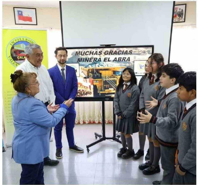
LA ESCUELA D-131 VALENTÍN LETELIER IMPLEMENTARÁ NUEVAS PANTALLAS INTERACTIVAS.