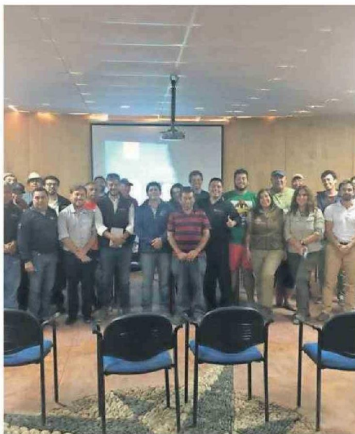
DURANTE LA SESIÓN.

regional (S) de Sernapesca Atacama, valoró la importancia de postular a proyectos de investigación FIPA para conocer y estudiar al detalle la situación de las áreas marinas protegidas. "Cuando se genera información técnica de calidad se pueden tomar mejores decisiones en torno a la gestión y administración de las Áreas Marinas Protegidas, junto a la comunidad, los usuarios y usuarias, y las demás entidades que participan en los comités de Administración y Consultivo", expresó.