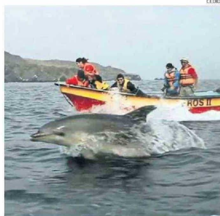
SE REALIZARON DIVERSAS MEDICIONES.

De esta forma se lograría aportar con información oportuna e importante para conocer el desempeño de la gobernanza y administración de la reserva, realizando una gestión adecuada y sustentable de ella y sus recursos, en conjunto con las comunidades locales como organizaciones de pescadores artesanales, operadores y guías de turismo, pueblos originarios, junta de vecinos, entre otros.