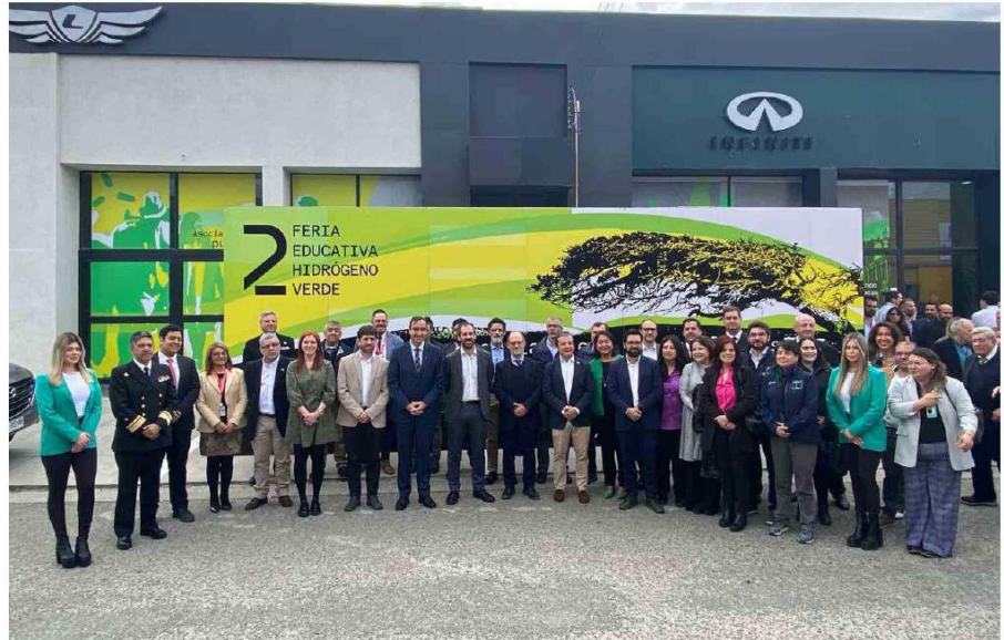
OTRO HITO IMPORTANTE EL AÑO PASADO, A RAÍZ DEL CRECIENTE INTERÉS DE LA INDUSTRIA DEL HIDRÓGENO EN MAGALLANES, FUE LA REALIZACIÓN DE LA FERIA DEL HIDRÓGENO EN PUNTA ARENAS.