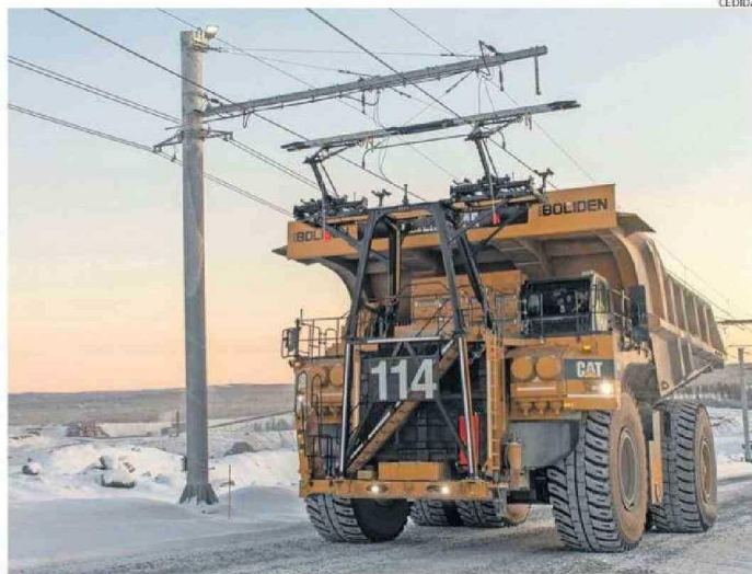
LA TECNOLOGÍA TROLLEY OPTIMIZA LAS OPERACIONES Y REDUCE EL IMPACTO AMBIENTAL DE LAS FLOTAS DE CAEX.

EFEECTO TRANSFORMADOR Desde Equans Chile, que pres-