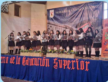
Coro de alumnos del liceo politécnico presentándose en la feria.