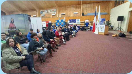
Acto inaugural feria liceo politécnico.