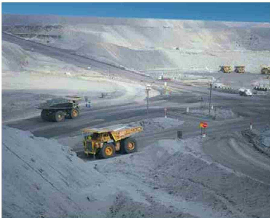
❑ Con el supresor de polvo H14 de Vialcorp, es posible ahorrar un 90% en consumo de agua para riego de caminos mineros.