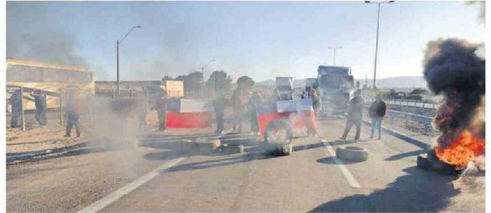
LOS PESCADORES ASEGURARON QUE PODRÍAN VOLVER A TOMARSE LOS CAMINOS.

Quizá a la Asamblea General de 2030, desde Atacama vaya una delegación de científicos que pudieran cumplir su anhelo de formación e investigación astronómica íntegramente en la región.