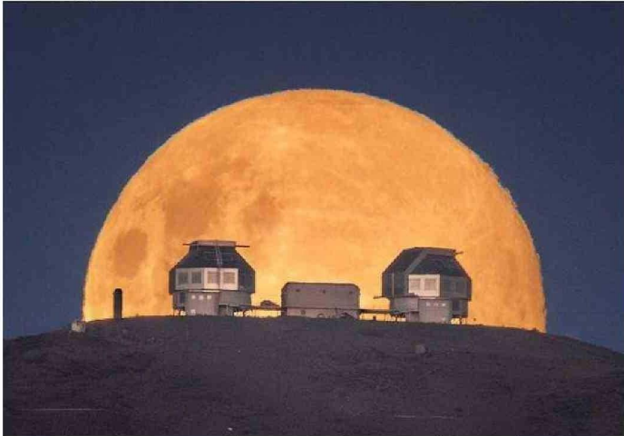
LOS TELESCOPIOS MAGALLANES SON LA MÁXIMA TECNOLOGÍA DE OBSERVACIÓN EN LA REGIÓN DE ATACAMA.