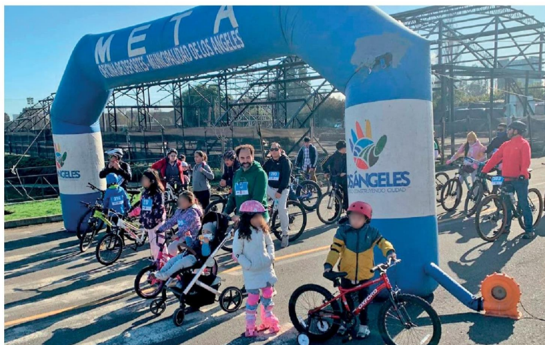
EN SU PRIMERA VERSIÓN la rodada de salud familiar convocó a decenas de participantes.

Según explicaron los profesionales, esta actividad consiste en realizar una ruta recreativa en cualquier vehículo con ruedas, sin motor, es decir, a tracción humana, como bicicletas, scooter, skate, sillas de ruedas, coches de bebé. "La idea es que este recorrido sea lo más inclusivo posible pues la actividad física es muy importante para todos y todas", apuntaron.