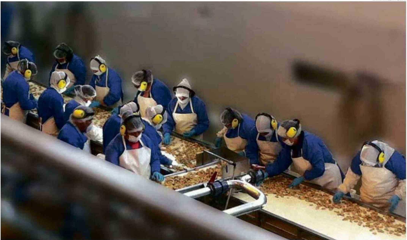
CHORITOS EXPORTA LA PLANTA DE PROCESO DE MEJILLONES RIA AUSTRAL DE LLANQUIHUE, DE ACUERDO A LA PÁGINA WEB, INCLUSO CON SUCURSALES EN ESPAÑA.