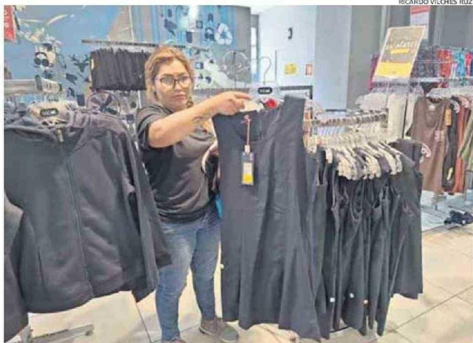
RECIENTE COMIENZA EL AÑO Y LAS TIENDAS PARTIERON CON LA VENTA DE UNIFORMES ESCOLARES PARA MARZO.

"Estamos comenzando al igual que todos los años, montando todos los productos escolares para adelantarnos a las compras escolares, y de esta manera satisfacer a nuestros clientes, que van a salir de