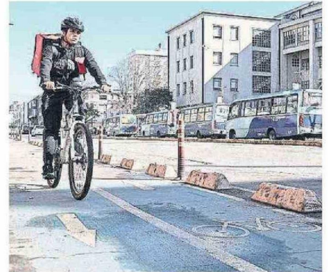
LOS CICLISTAS ESPERAN EN UN FUTURO TENER MÁS CONEXIONES.

A pesar de que el Gran Concepción es noveno a nivel nacional en tener mayor extensión de infraestructura ciclista, siguen existiendo zonas sin conexión.