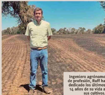
Ingeniero agrónomo de profesión, Ruff ha dedicado los últimos 14 años de su vida a sus cultivos.

■ En unos $ 60 millones calcula las pérdidas en que se tradujo que parte de su cosecha de trigo se viera quemada, así como maquinaria.