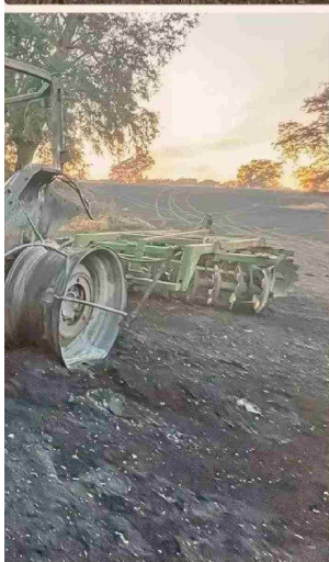
Hasta este jueves, de hecho, continuaba el combate de 21 siniestros, 13 de ellos en La Araucanía. En las imágenes se observa el impacto que tuvieron los incendios en predios y maquinaria.