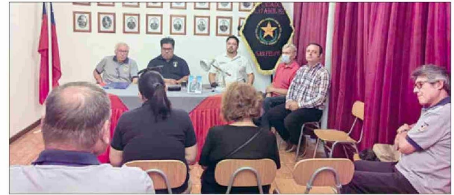
El pasado miércoles 8 de enero, los miembros honorarios del club de adulto mayor 'Moisés del Fierro y Arcaya' anunciaron su proyecto sobre la reedición del libro 'Historia de San Felipe'.

El lanzamiento oficial se realizará en junio del 2025 aproximadamente, sin embargo,