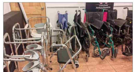
Algunos de los implementos médicos que el club de adultos mayores ha logrado adquirir por medio de los proyectos de SENAMA.

se harán otras tres divulgaciones; una exclusivamente con bomberos, otra abierta a la comunidad y una tercera dirigida al mundo de la cultura e historia; todas ellas con una distribución gratuita del libro.