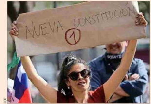
"El lazo más claro entre el periodo que estudio y la época actual, sobre todo entre 2019 y 2022, es la impugnación de la democracia vigente y la búsqueda de una 'democracia nueva'".

"El vínculo más claro que podría establecer entre el periodo que estudio y la época actual, en especial entre 2019 y 2022, es la impugnación de la democracia vigente, la reivindicación de un 'pueblo' oprimido y la convicción de que es posible crear una nueva y más verdadera democracia, en particular a través de una nueva Constitución paritaria y plurinacional. En muchos sentidos, el pensamiento sobre la democracia en Chile a mediados del siglo XX tuvo mucho de impugnación de la democracia liberal y, en su resaca, de un pueblo oprimido por ella, fue también un pensamiento de visos populistas, si es que pensamos en la definición actual de populismo".