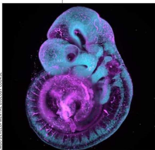
En la primera imagen, se puede ver un embrión de ratón y, en la segunda, un invertebrado marino, ambas en 3D. Estas fueron obtenidas con un ZEISS lightsheet 7 microscope , pero similares se podrán capturar con el Flamingo .

Por eso, enfatiza la importancia de que, al menos el equipo que permanezca en Chile, "quede a disposición de otros investigadores, para poder colaborar y permitir a todos los científicos del país crecer en la investigación, llegar a revistas y realizar estudios de mayor impacto a nivel mundial".