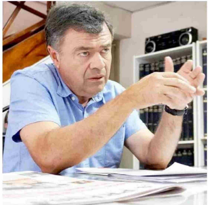
El ministro de Agricultura, Esteban Valenzuela, asegura que el precio de las cerezas en el mercado chino se recuperará rápidamente.

• Pese a la inquietud de los agricultores maulinos, el secretario de la cartera más importante para la región asegura que finalmente las cifras serán positivas y que "(los precios de la cereza) ya están teniendo un rebrote, está en 3 dólares 30 por kilo y mientras nos acercamos al Año Nuevo Chino hay expectativas de que el precio mejore, hacia fin de mes".