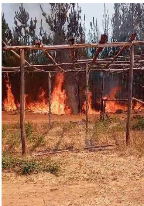
Está ubicado en el sector Lingue Bajo.

res de calidad en la atención. Además, asegura el respeto a los derechos y deberes de los pacientes, lo que permitirá que, en caso de concretarse el proyecto, los futuros especialistas estén plenamente preparados para enfrentar los desafíos de la salud públi-