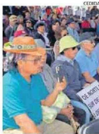
SOLCOR SERÁ LA ANFITRIONA.