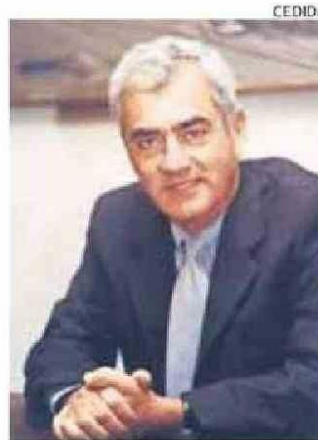
LIDERÓ MINERÍA EN 2002-2006.