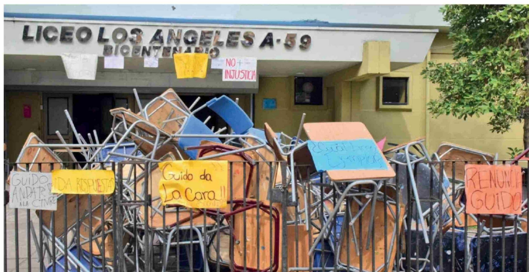
CON EL MOBILIARIO del propio establecimiento, los alumnos del Liceo Bicentenario de Los Ángeles se tomaron el recinto educativo.

Jefe del DAEM expresó su voluntad de "clarificar situaciones y llegar a acuerdos de mejora y de trabajos que están en proceso de licitación. También con el área de convivencia escolar para dar respuesta a sus demandas".