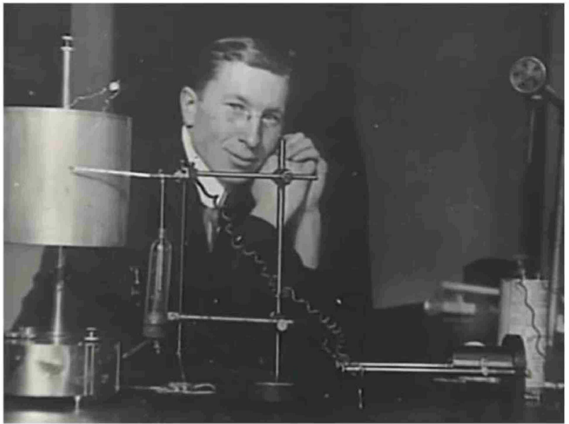
Antes de convertirse en médico, Banting sintió la vocación de ser sacerdote: al terminar el secundario empezó a estudiar Teología en la Universidad de Toronto.