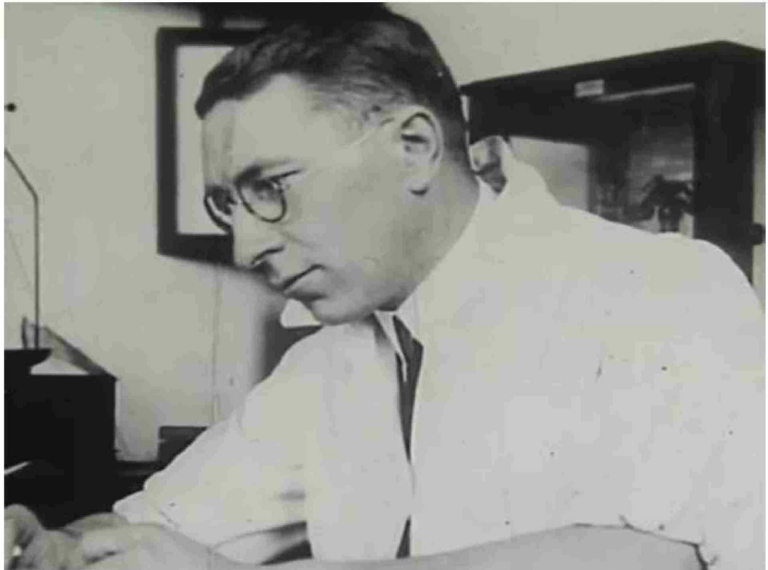
En 1923, cuando solo tenía 32 años, Frederick Grant Banting recibió el Premio Nobel de fisiología y Medicina: es el científico más joven en recibir el galardón.