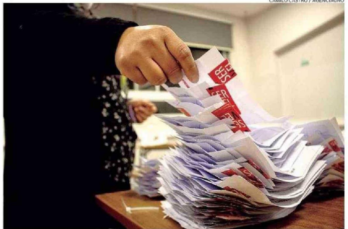
EN OCTUBRE SE DESARROLLARÁN LAS VOTACIONES MUNICIPALES.

Y si bien menciona que los comicios de alcalde también sirven para sondear, su sistema es de votación directa. "La