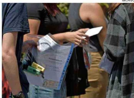
MILES DE ESTUDIANTES RINDEN EL EXAMEN.

invierno, hay directrices claras que pueden ayudar a tener un desempeño idóneo.