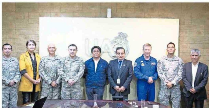
REPRESENTANTES DE LA UA, FACH Y EL GOBIERNO REGIONAL SE REUNIERON PARA COORDINAR EL PROYECTO.

Es por ello que durante estos días se realizó una reunión en la Universidad de Antofagasta (UA), casa de estudios que tendrá la misión de enfocarse en el desarrollo de capital humano y de los diseños de laboratorios para la construcción y operación de satélites de comunicaciones, gracias a la experiencia de sus centros de Investigación, Tecnología, Educación y Vinculación Astronómica (Citeva) o de Fisiología y Medicina de Al-