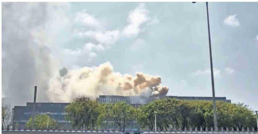
CERCA DE LAS 11 DE LA MAÑANA COMENZÓ EL INCENDIO EN EL CUARTO PISO DEL HOSPITAL REGIONAL DE ANTOFAGASTA.

Además, el reingreso controlado de pacientes y personal comenzó a las 12:16, priorizando la read-