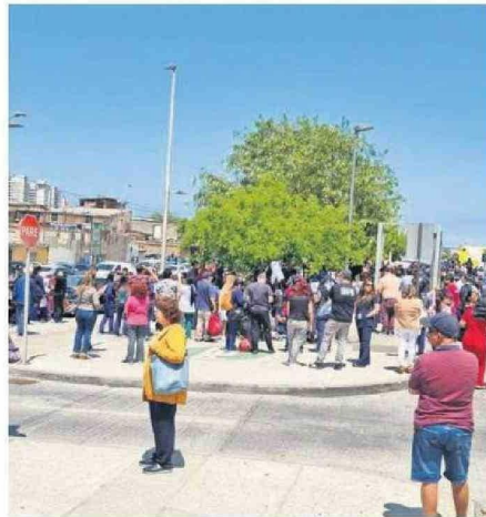
LA EMERGENCIA OBLIGÓ A EVACUAR A 2.600 PERSONAS.