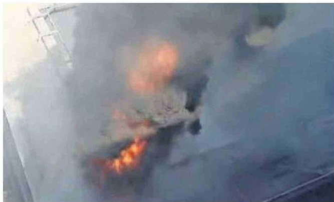
EL INCENDIO INICIÓ CUANDO SE HACÍA MANTENCIÓN DEL SISTEMA DE ENFRIAMIENTO.