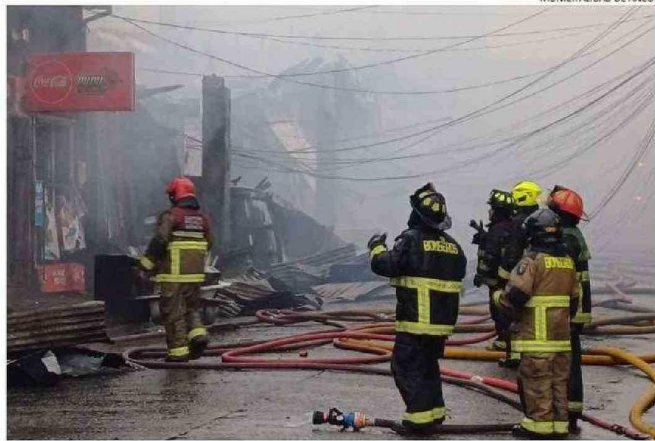
MUNICIPALIDAD DE ANCUD