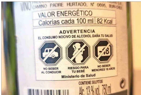
Botellas y cajas de bebidas alcohólicas ya incorporan el etiquetado.

Consumo de Sustancias y el Tratamiento de las Adicciones (Cesa), de la U. de Chile. Al día, 36 chilenos mueren por esta causa: "Hablamos desde homicidios, accidentes de tránsito, suicidios hasta enfermedades en que el alcohol es un importante factor de riesgo como la cirrosis y algunos cánceres".