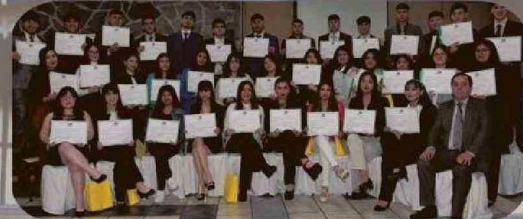
ESPECIALIDAD DE ADMINISTRACION MENCION LOGISTICA