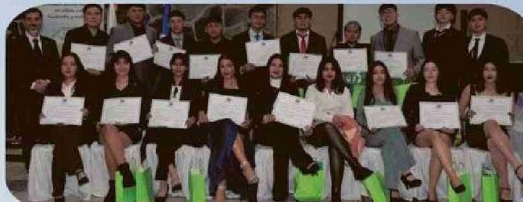
ESPECIALIDAD DE AGROPECUARIA MENCION EN AGRICULTURA