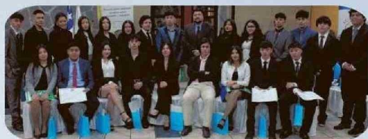
ESPECIALIDAD DE ACUICULTURA