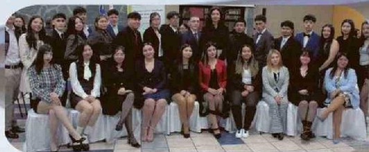
ESPECIALIDAD DE SERVICIO DE HOTELERIA